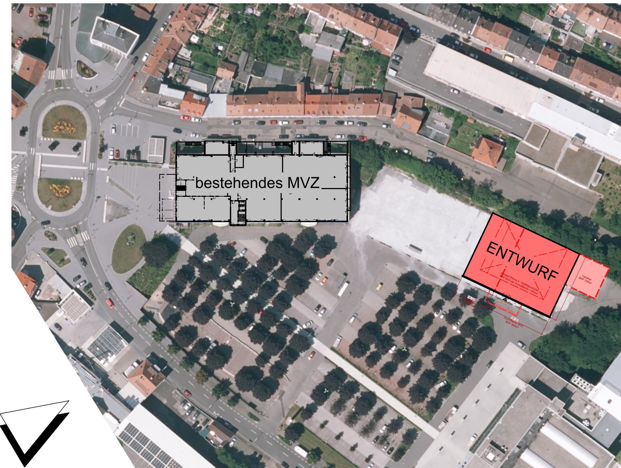
Digitales Luftbild Maßstab ca. 1:1000