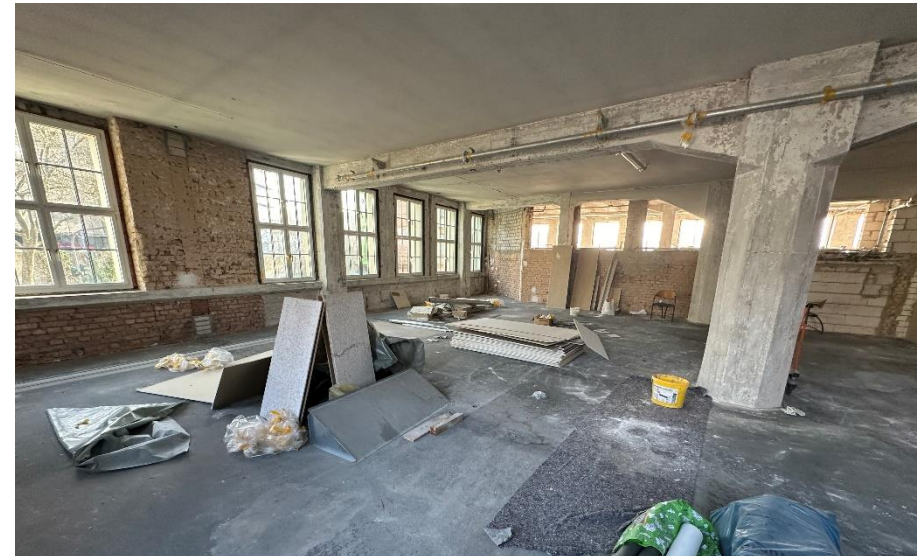
Fläche im I. Obergeschoss