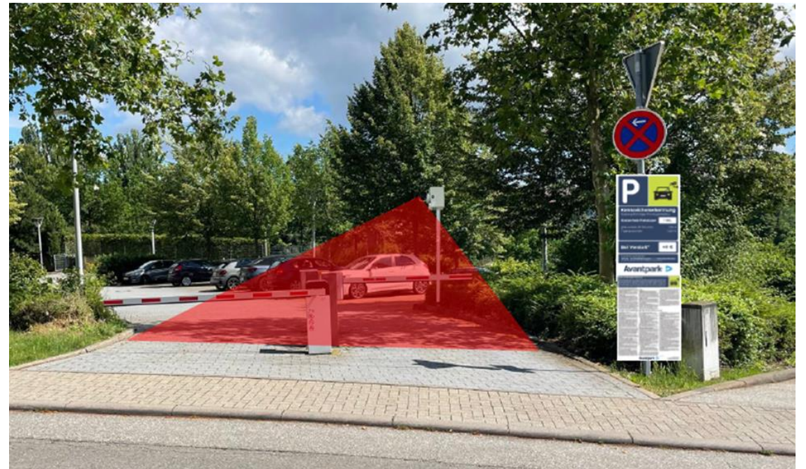
Parkplatz „Roland-Betsch-Straße“ Ein- und Ausfahrt