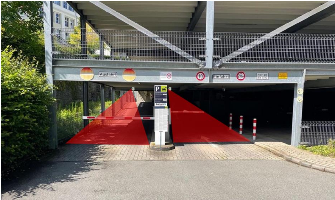
Parkhaus „Der Rheinberger“ Ein- und Ausfahrt