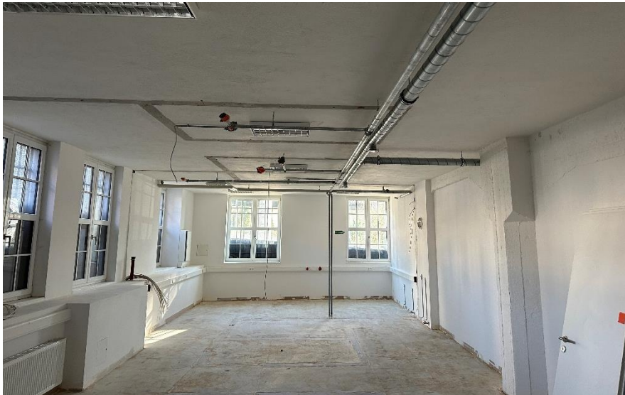
Fläche im Erdgeschoss – Ebene Eingang Fröhnstraße