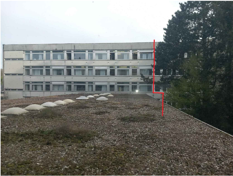
BILDAUSSCHNITT ANSICHT SÜD -TRAKT B - 2. BAUABSCHNITT