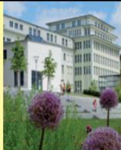
Natur pur ...!