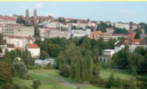
Strecktal-Park Panorama Pirmasens