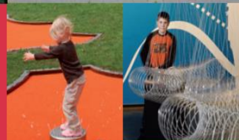
Rheinberger-Komplex mit DYNAMIKUM