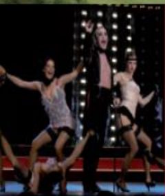
Kultu · Theater · Kunst