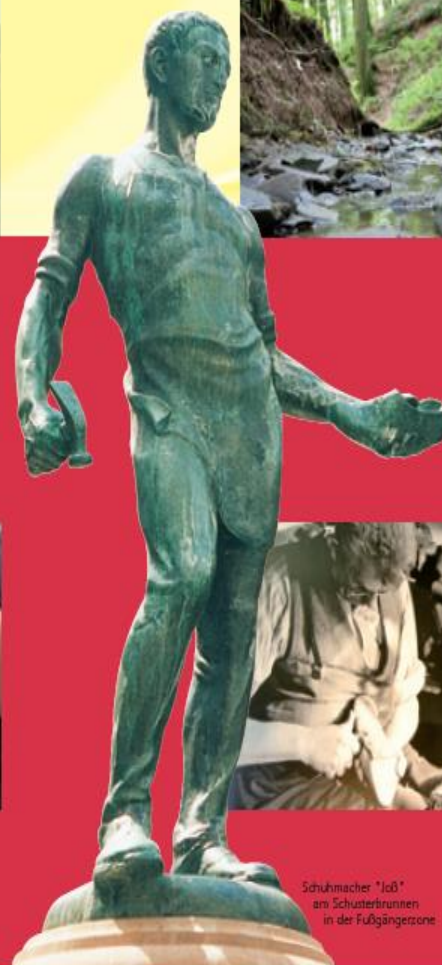
Schuhmacher "Joß" am Schusterbrunnen in der Fußgängerzone